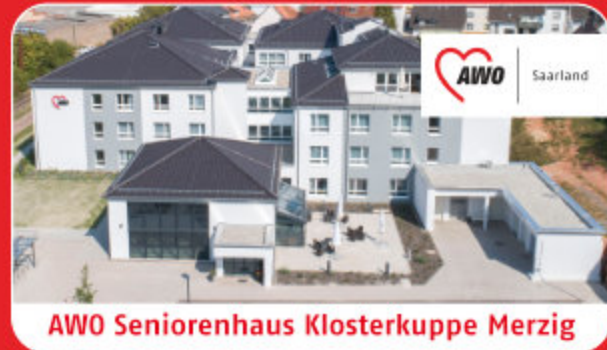
AWO Seniorenhaus Klosterkuppe Merzig

AWO Seniorenhaus Klosterkuppe Schillerstraße 23a 66663 Merzig Telefon: 06861 / 9374 100 Fax: 06861 / 9374 104